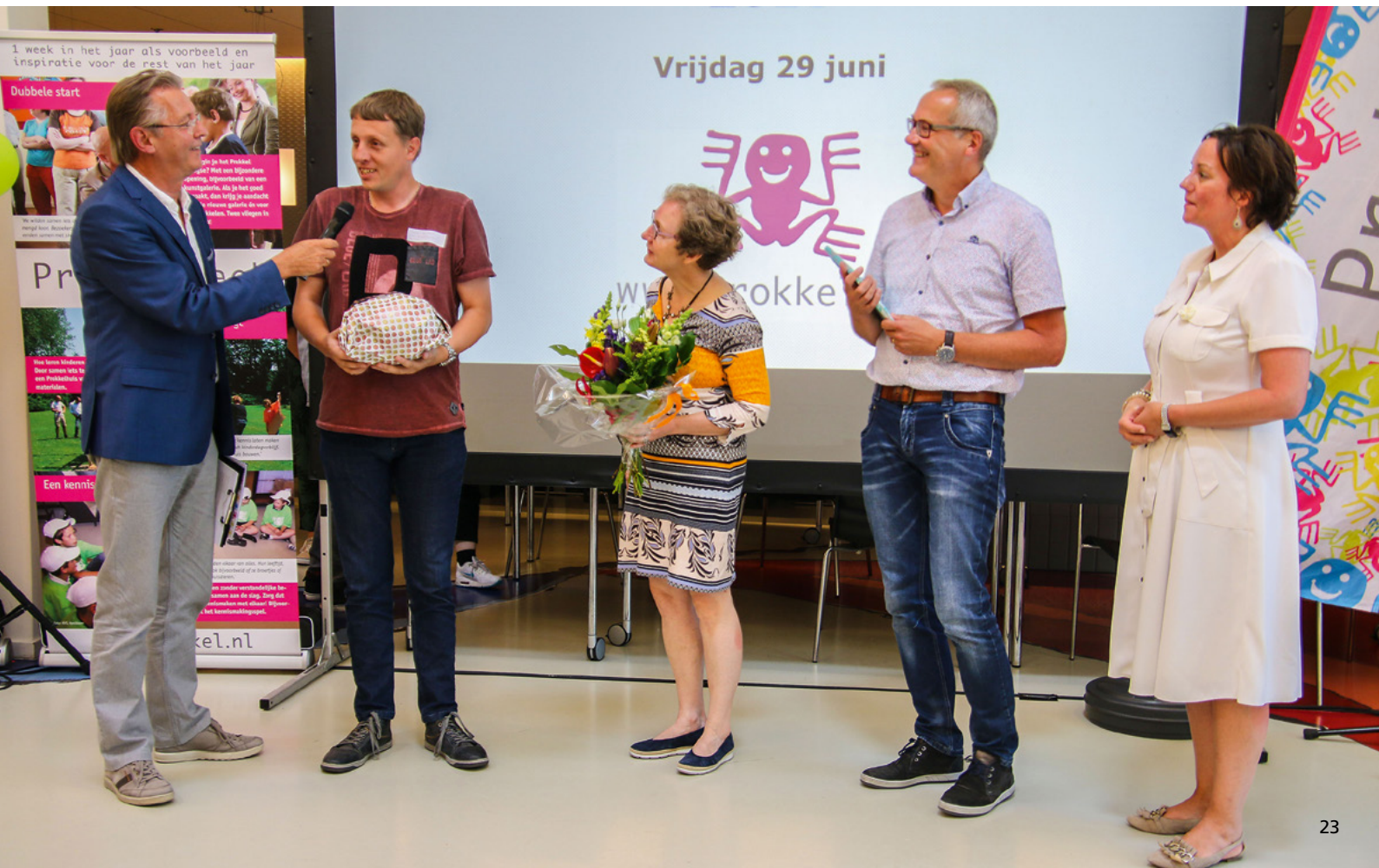
▼ Klankbordgroep Gorinchem: de trotse winnaar van de Gouden Prokkel in 2018

Neem contact op met Shahrzad Nourozi, s.nourozi@movisie.nl , 06 554 405 76.